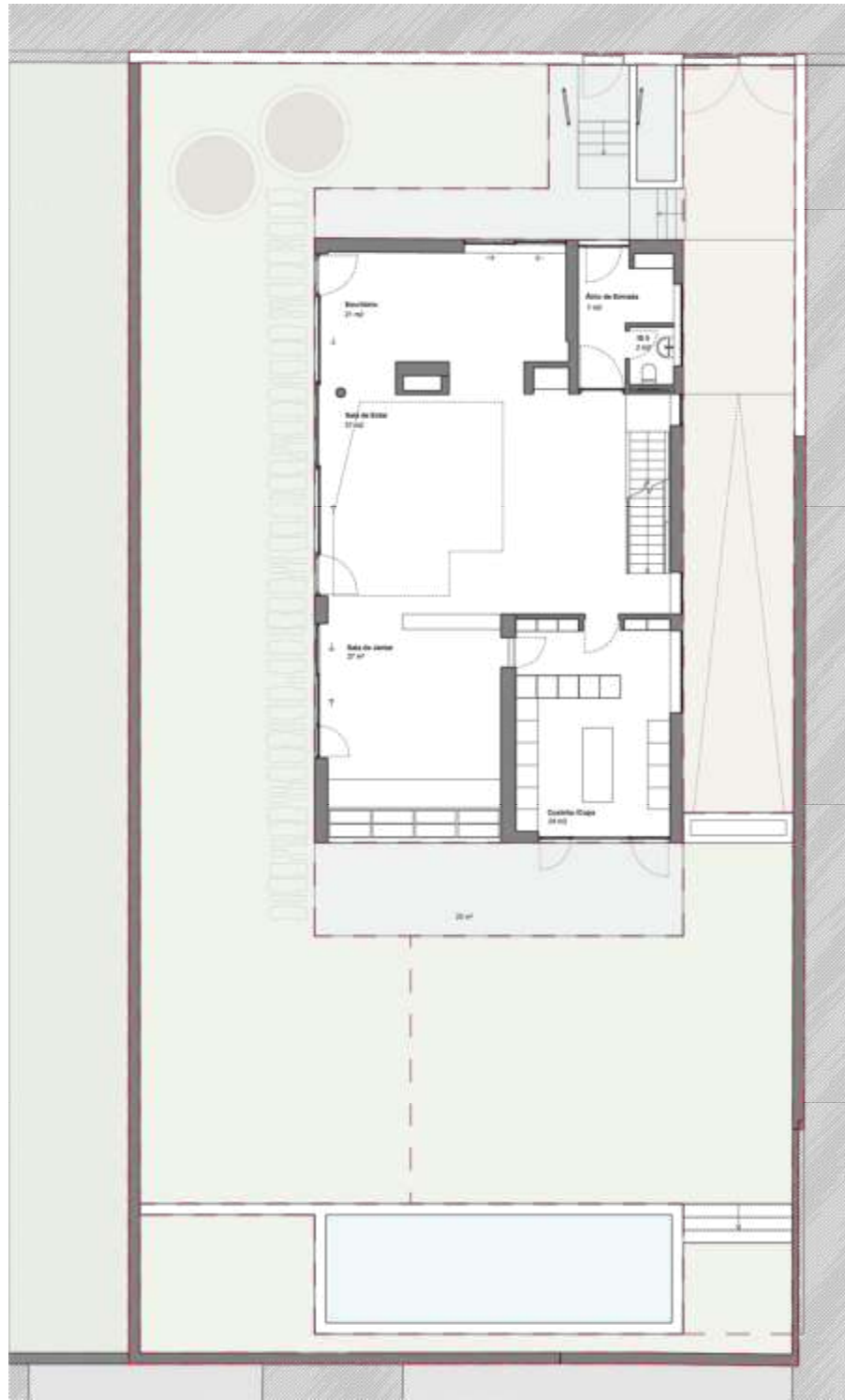
PLANTA PISO RC_piso 1