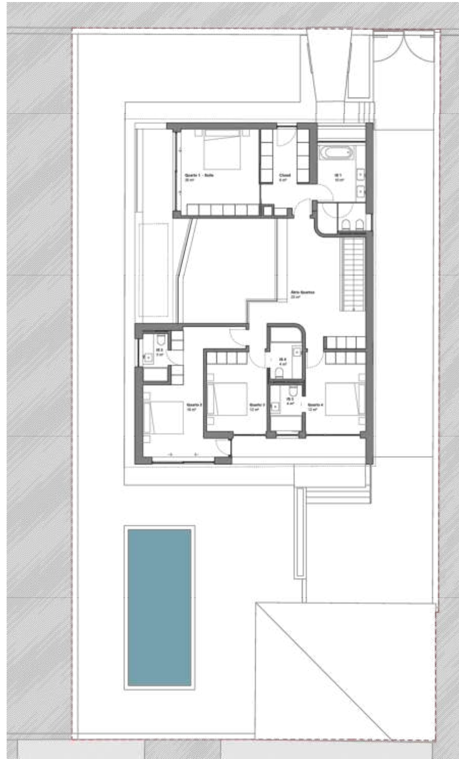
PLANTA PISO 1_0103