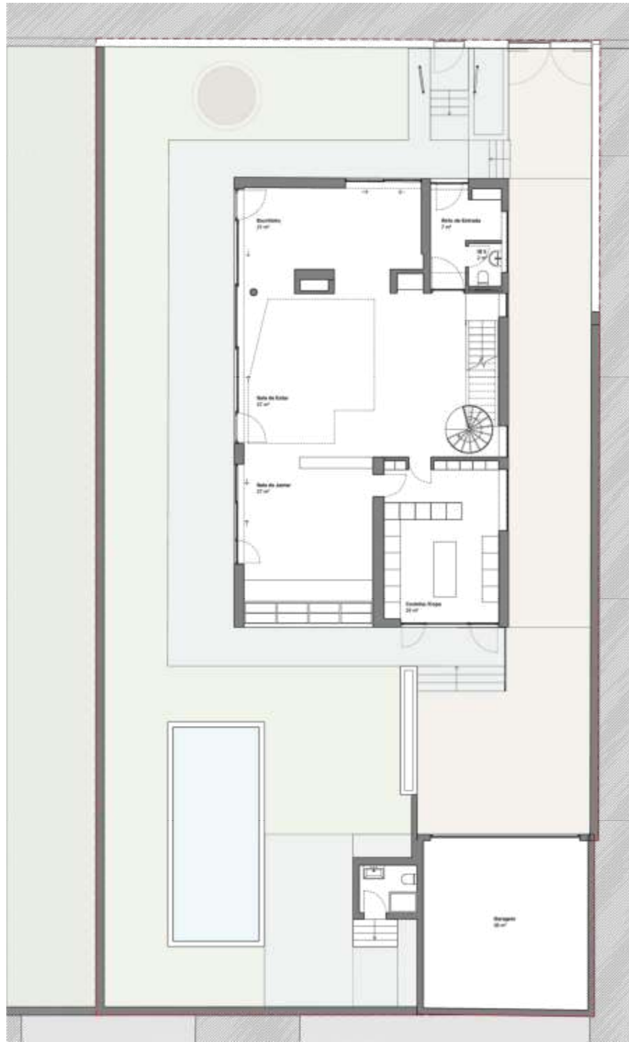
PLANTA PISO RC_0102