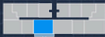
PISO 2 2ND FLOOR