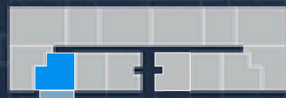
PISO 2 2ND FLOOR