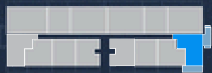
PISO 5 5TH FLOOR