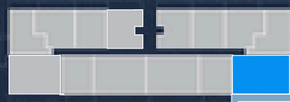
PISO 5 5TH FLOOR