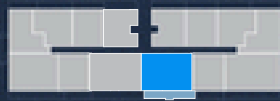
PISO 4 4TH FLOOR